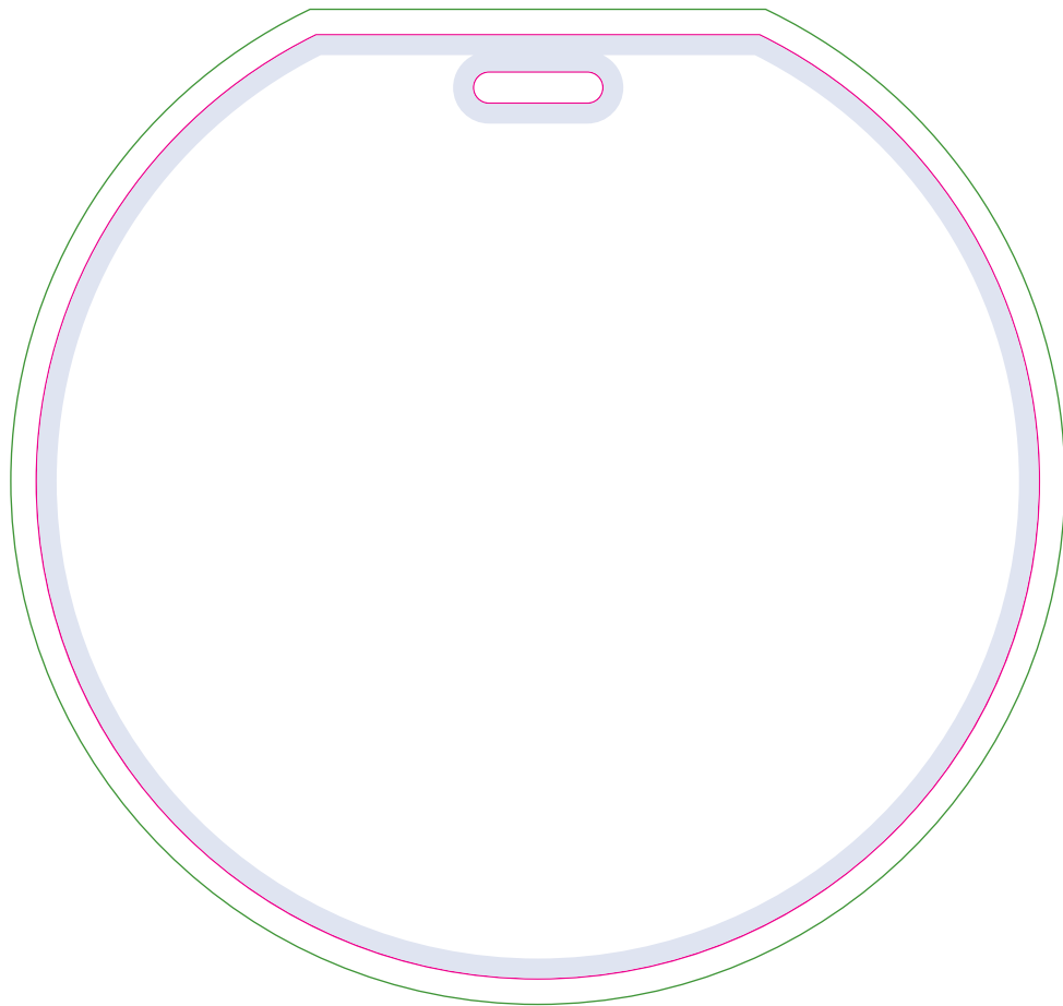
Front / Recto